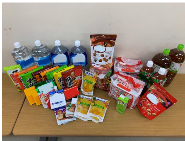
配布する食料品・飲料水等（例）